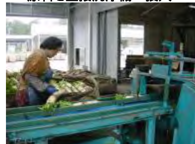
原料を直接洗浄機へ投入

そこでこのような問題をすべて解決した大根洗浄機が (HFURC シリーズ) です。写真のように直接原料を洗浄機に投入できます。