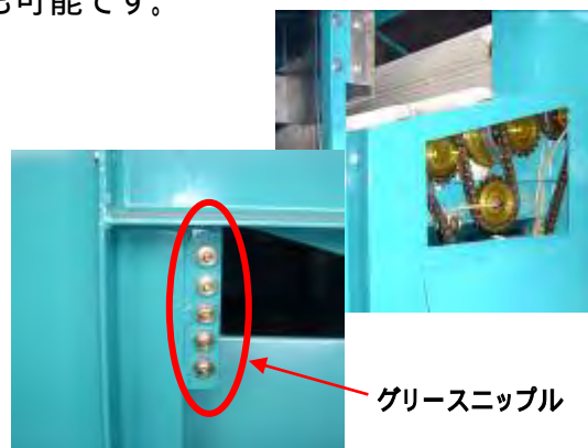
グリースニップル

また、洗浄後の掃除やメンテナンスも容易です。グリース補給はカバーをはずすことなく脚に集中したグリースニップルに補給するだけ。至って簡単です。