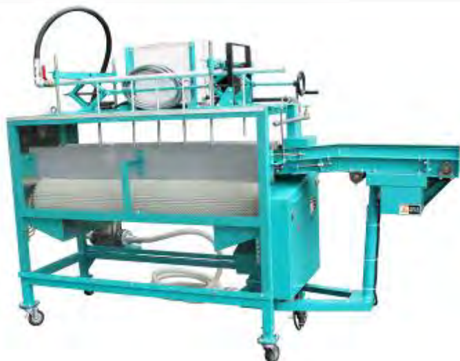
投入コンベヤーはオプションです。

3Sは 洗浄機と洗浄ポンプが一体 となっており、その分省スペースで使用できることが一番の特徴です。