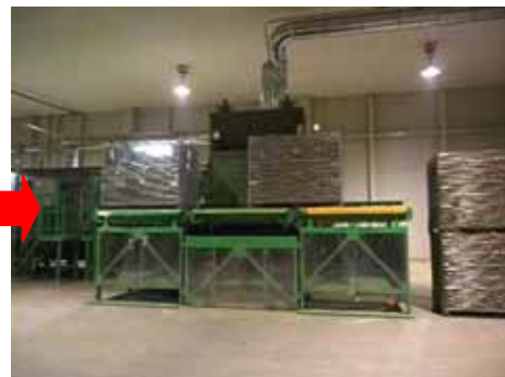
右にあった原料コンテナを中央へ移動