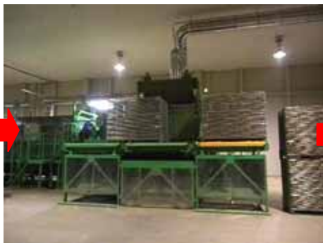
空になったコンテナを左へ移動