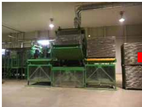
受入ホッパーへ原料を投入